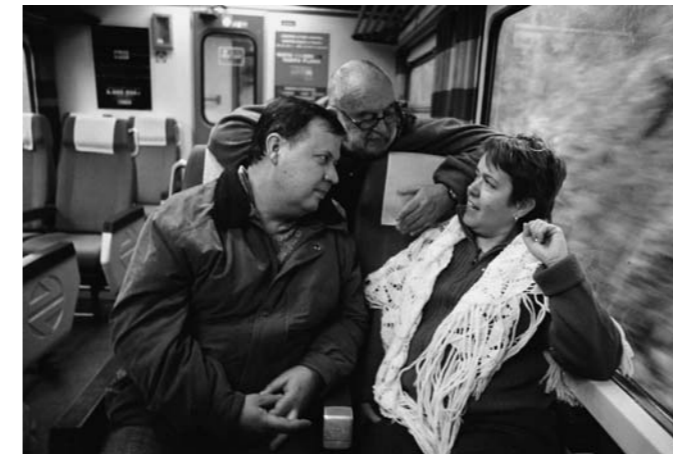
E 2005 Regie: Joaquín Jordá, Buch: J. Jordá & Laia Manresa, 118 min, OmenglU.

Ausgehend von der Lebensbeschreibung der Protagonisten der selbstverwalteten Fabrik Numax gegen Ende der 70er Jahre versucht der Film die Geschichte der letzten 25 Jahre Spaniens wiederzugeben. Die Sequenz des Abschiedsfestes von "Numax presenta..." wird zum Ausgangspunkt des neuen Films. Während dieser Feier, die den Abschluss einer zwei Jahre dauernden Selbstverwaltung bildete, hören wir die Wünsche einer Reihe von ArbeiterInnen, kurz bevor sie ihr Lohnempfängerdasein beenden. Der Film erzählt, was aus ihrem Leben seitdem geworden ist. Die Spuren dieser ArbeiterInnen, die über mehr als zwanzig Jahre nachverfolgt werden, zeichnen ein genaues Bild einer Klasse und einer Generation, die die schwierigen Jahre des industriellen Abbaus erlebt hat.