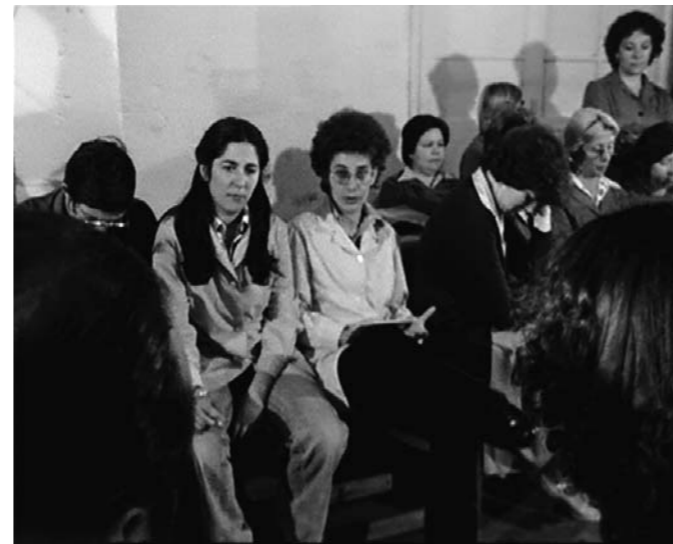
E 1979, Regie & Buch: Joaquín Jordá, 101 min, OF. Mit einer Einführung in den Film

1979 filmte Joaquín Jordá "Numax presenta...", einen Dokumentarfilm, der die Selbstverwaltungserfahrung der ArbeiterInnen des Hausgeräteherstellers Numax schildert, die damit auf den illegalen Schließungsversuch der Besitzer antworteten. Der Film wurde damals auf Wunsch der ArbeiterInnenversammlung von Numax gemacht, die, kurz vor ihrem Ende, beschloss, die letzten 600.000 Peseten aus der Widerstandskasse zu investieren, um den Prozess zu dokumentieren, in dem sie alle Protagonisten gewesen waren. Ein Prozess, in dem sie sich vor allem eine andere Art des Denkens angeeignet haben, um in einem sehr bestimmten historischen Moment - dem der spanischen Transition zur parlamentarischen Demokratie - eine andere Zukunft zu projektieren.